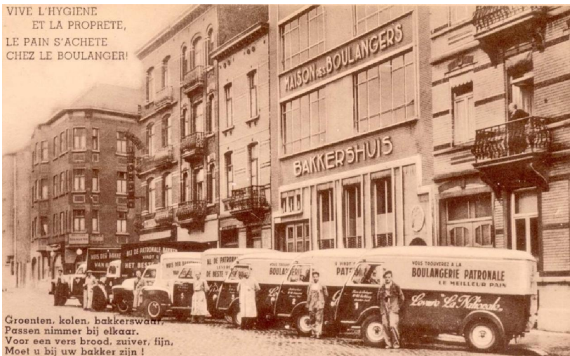
Het Bakkershuis in de Delaunoystraat in Brussel