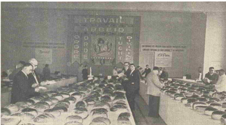
De examinering van de broden op een vakwedstrijd van de Landsbond van Bakkersbazen.

De Landsbond organiseerde vanaf 1923 vakwedstrijden in verschillende categorieën, nl. gewoon brood, pistolets en Frans brood, beschuiten en klein gebak.