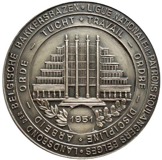
Prijspenning type 5